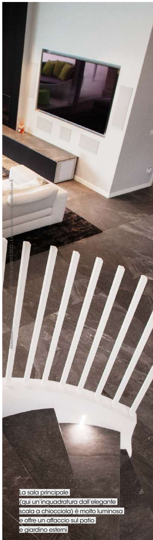
La sala principale (qui un'inquadratura dall'elegante scala a chiocciola) è molto luminosa e offre un affaccio sul patio e giardino esterni.