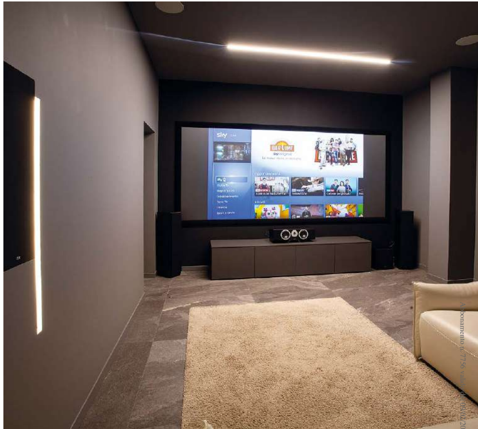
La sala cinema (foto sopra e sotto) ha la cubatura ideale per esprimere un ascolto da manuale. Presto verranno svolti lavori di trattamento acustico.

La stanza (che verrà implementata prossimamente su progettazione ancora di Audio Quality con un trattamento acustico di grande rilievo, basato sull'installa-