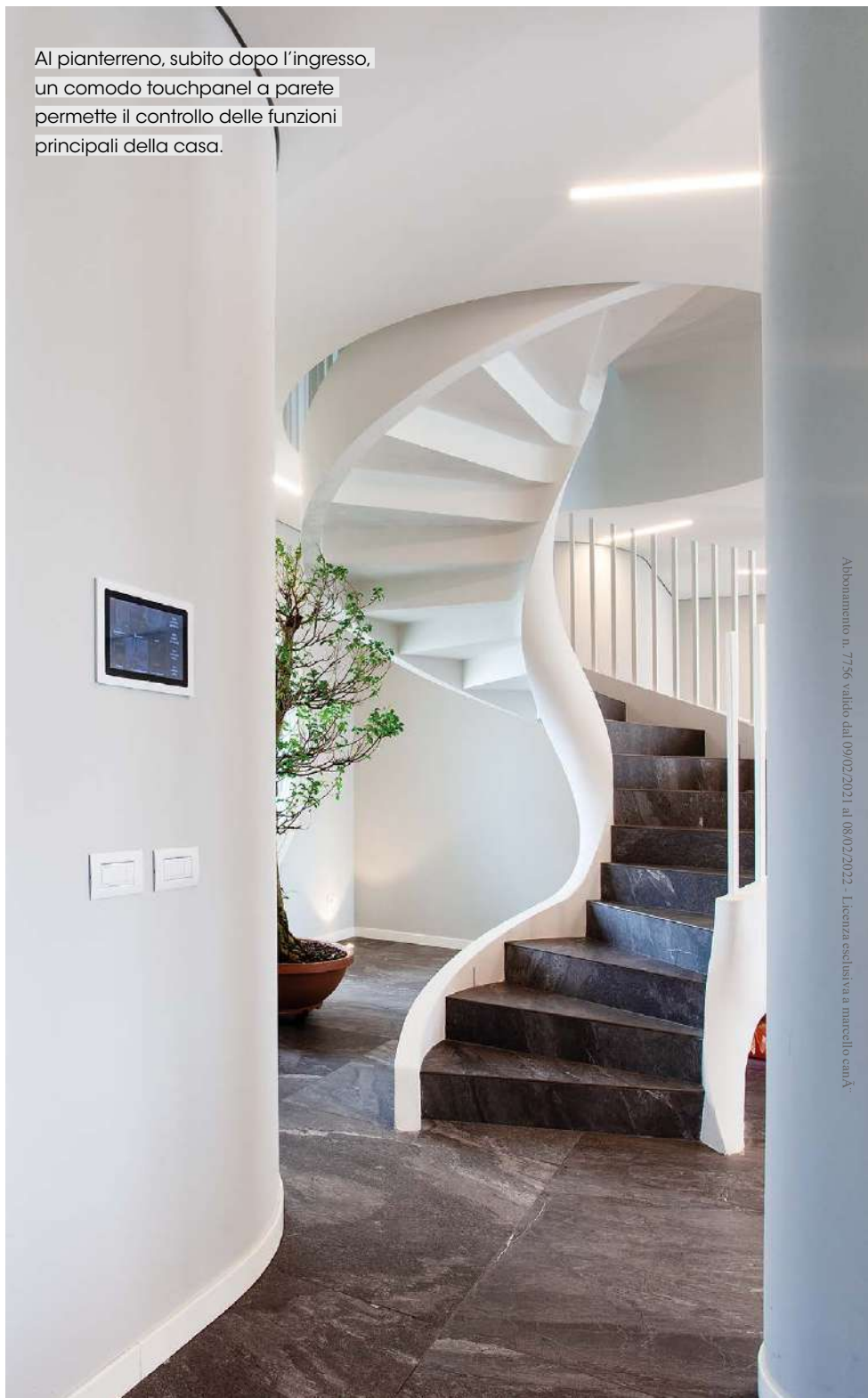
Al pianterreno, subito dopo l'ingresso, un comodo touchpanel a parete permette il controllo delle funzioni principali della casa.

C i sono passioni e passioni. Affermazione un po' tautologica ma vera, perché solo alcune di queste, oltre a seguirci per tutta la vita, ci spingono a volere sempre di più e a rendere migliore il vivere quotidiano, sia dal punto di vista del benessere mentale che da quello del comfort domestico. Ne è un perfetto esempio la passione per